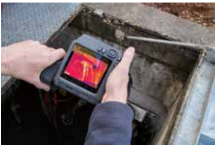
最大161,472ピクセルの高解像度