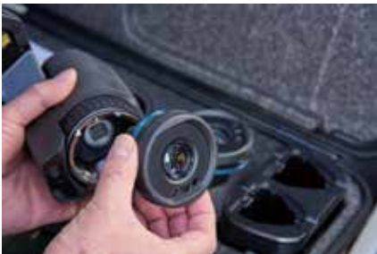
AutoCal™ 光学によりシリーズの全カメラでレンズ (広角から望遠) の共有が可能